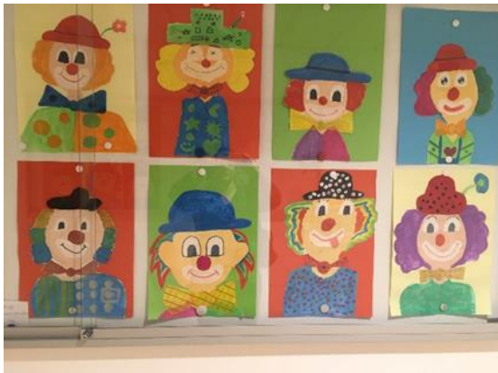
Die Klasse 4a wünscht schöne Faschingsferien