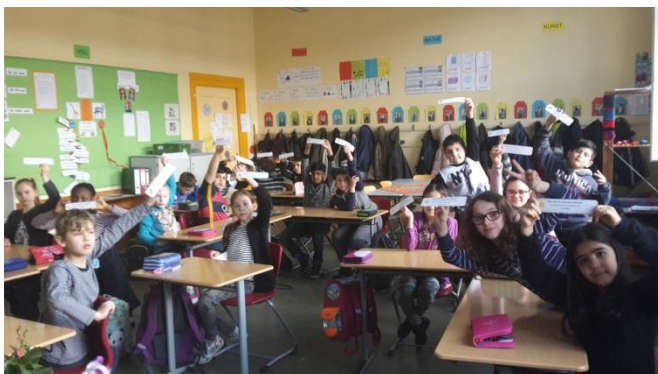
Die Schüler und Schlerinnen der Klasse 3a zeigen stolz ihre Ziele für das zweite Halbjahr.

In den 1. bis 3. Klassen haben dieses Jahr die Lernentwicklungsgespräche stattgefunden. Vielen Dank, dass so viele Eltern ihr Kinder begleiteten. Die Rückmeldungen der Lehrkräfte waren überwiegend positiv. Auf dem Foto zeigen die Schüler der Kase 3a stolz ihr Zielvereinbarungen für das nächste Halbjahr.